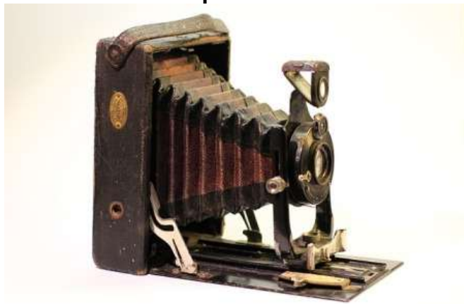
Foto- und Videoclipwettbewerb

Die Europäische ARGE Landentwicklung und Dorferneuerung veranstaltet im Rahmen eines von der EU geförderten Projektes einen europaweiten Foto- und Videoclip-Wettbewerb unter dem Titel „European Rural Benefits & Innovation“. Zu gewinnen gibt es unter anderem einen Kurzurlaub!