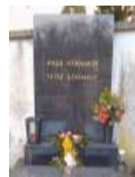
Wo befindet sich dieses Grab?