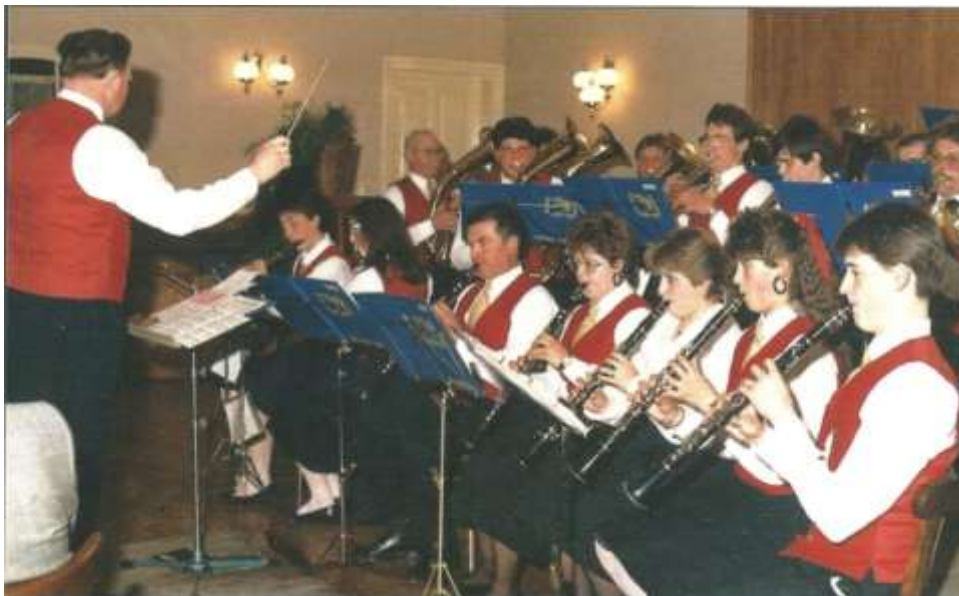
Frühjahrskonzert der Musikkapelle Langau im Gasthaus Lenz 1993