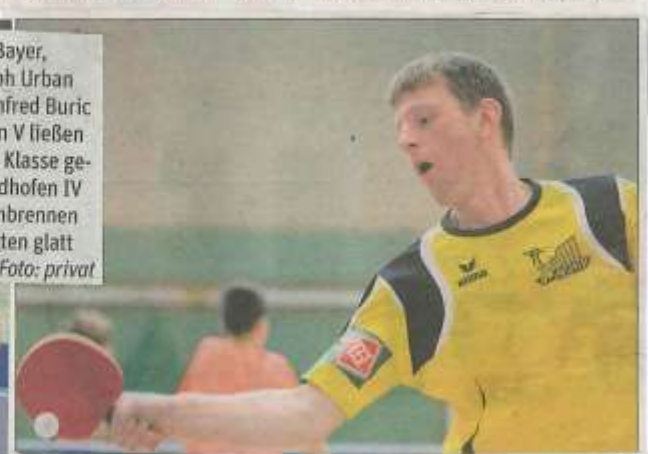
Martin Bayer & Co. ließen mit Horn V in der 1. Klasse bei Waidhofen V keinen Zweifel aufkommen: 7:0 gewonnen.